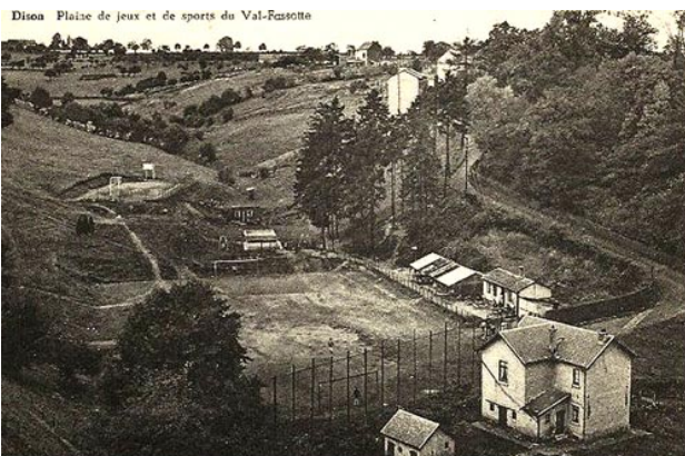
Sur cette vue, prise depuis la colline surplombant le portail du tunnel de Hodimont, nous découvrons la plaine de jeux du Val Fassotte et la deuxième maisonnette.

Immédiatement après, en plein virage de la Rue du Bois (voir plan ci-après), on tombait sur une deuxième maisonnette, plus étroite que la première et perpendiculaire à la voie ferrée qu'elle surplombait.