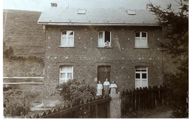
Sur cette vue, ce même portail, que nous apercevons dans le coin gauche, en contrebas de la 2e maisonnette.