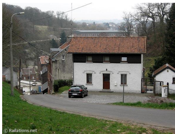
La maisonnette rescapée dominant de bien haut la Rue du Bois depuis la plate-forme de l'ancien passage à niveau (14 décembre 2015 et 30 mars 2012)