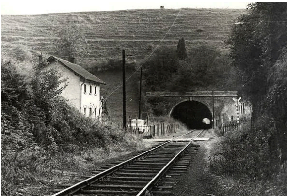
De part et d'autre de la maisonnette du passage à niveau: le portail sud du Tunnel de la Pisseroule (72 m), et en face le portail nord du Tunnel de Hodimont (409m).

Immédiatement après, en plein virage de la Rue du Bois (voir plan ci-après), on tombait sur une deuxième maisonnette, plus étroite que la première et perpendiculaire à la voie ferrée qu'elle surplombait.