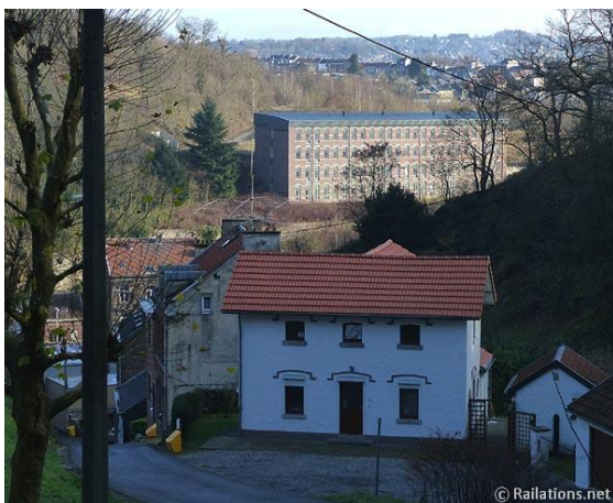
La maisonnette du Val Fassotte (14 décembre 2015)

Le terrain de sports et de jeux du Val Fassotte, datant des années 20 du siècle passé et situé peu au-delà, a disparu lui aussi, enseveli sous l'énorme masse de terre et de gravats produits par les travaux de l'E42 toute proche. Seule rescapée de ce site remarquable, la maisonnette du garde-barrières continue par contre de défier le fil du temps. Récemment repeinte, elle est aujourd'hui un des trop rares témoins visibles de ce tracé ferroviaire disparu à tout jamais (vue ci-dessous).