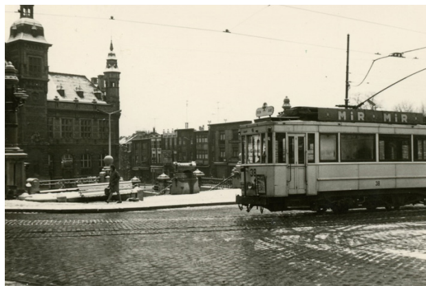
Motrice 38 sur la ligne 4, place de la Victoire, mars 1962.