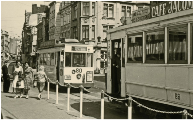
Deux motrices sur la ligne 1 barré, place verte, 9 juin 1962