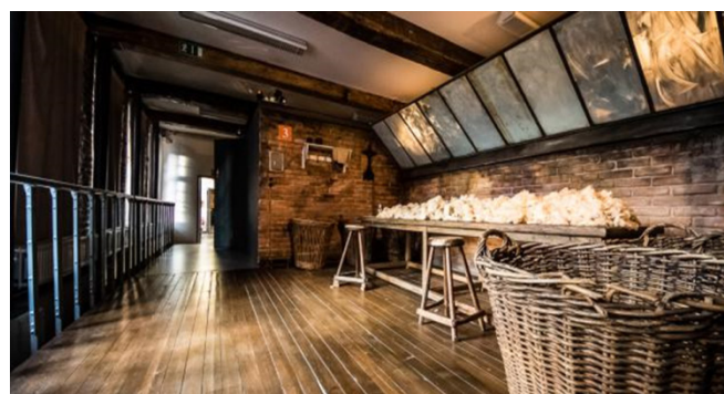
Centre touristique de la Laine et de la Mode, parcours permanent (le tri de la laine)

Le musée organise donc régulièrement des expositions et propose une offre très complète en matière d'animations autour de la mobilité, développées afin de toucher le plus large public possible.