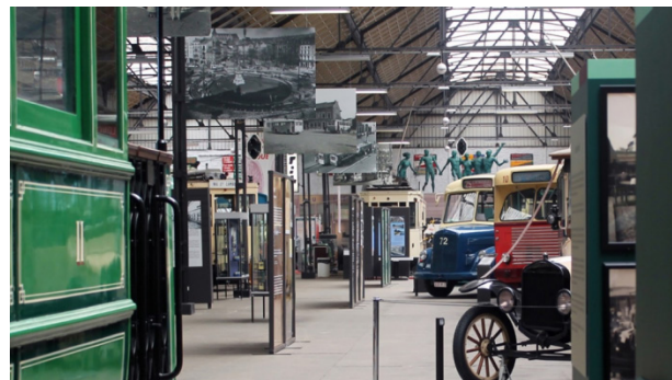
Musée des Transports en commun de Wallonie, l'entrepôt