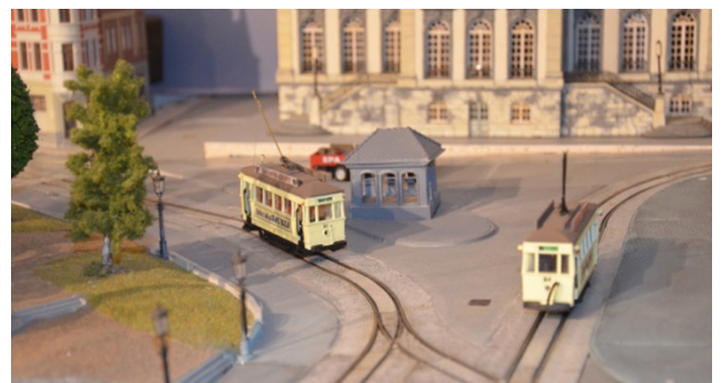
Maquette réalisée par M Patrick Hoffsummer (précisions infra infra)

Afin de commémorer la fin des derniers trams verviétois à la date anniversaire marquant ce jubilé, une exposition de trois photographes amateurs s'est tenue en décembre 2019 dans la Salle Noire située au rez-de-chaussée du CTLM. Cette exposition « teaser » annonçait l'exposition principale qui, du fait de la pandémie, se répartit finalement en un pan physique (sur site) et un pan virtuel.